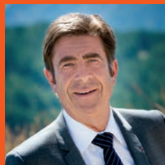
Charles Ange GINÉSY

Une nouvelle campagne sera ouverte du 16 avril jusqu'au 7 décembre 2018 et j'encourage vivement toutes les personnes concernées à y avoir recours afin que, collectivement, nous limitions la propagation du frelon asiatique dans les Alpes-Maritimes.